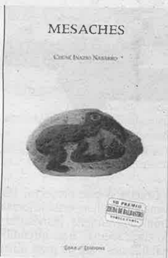
Portada del libro de Nabarro.

>La literatura en aragonés ha ido ampliando su repertorio temático